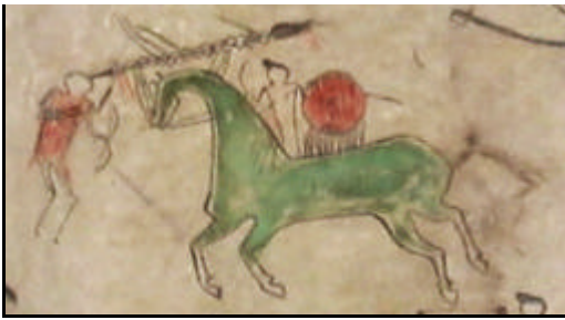
Kriegstat auf einem Bisonfell vom oberen Missouri, um 1840