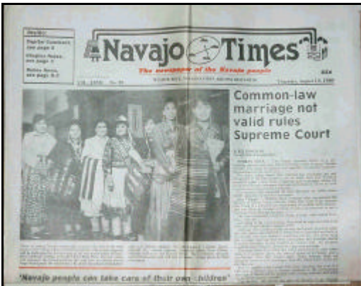
Zeitungen als Vermittler indianischer Interessen sind heute nicht mehr wegzudenken.