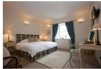
Hotel auf Islay

Das Klima auf Islay ist dank des Golfstroms recht mild. Islay bietet für Vogelliebhaber eine reiche Auswahl. Auf der Insel findet man zahlreiche Vogelarten. Dazu zählen die Alpenkrähe, Kornweihe, Seeadler, Austernfischer, Kormorane und viele Wattvogelarten. Nicht weit von Ihrem Hotel / Guesthouse entfernt befindet sich die Islay Woolen Mill. Im Shop bleibt (fast) kein Wunsch unerfüllt und vom Tweed bis zum edlen Cashmere ist fast alles erhältlich.