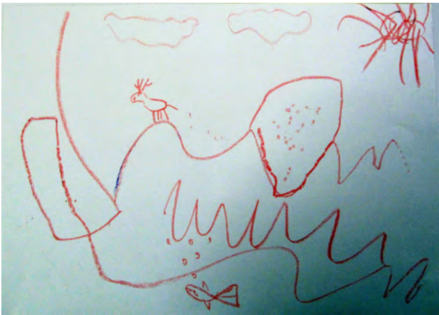
Abb. 1 Dialogisches Gestalten 9. Sitzung