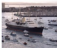
Royal Yacht Britannia

Die Britannia wurde auf der Werft John Brown & Company Ltd. in Clydebank (Schottland) gebaut. Nach ihrem Stapellauf am 16. April 1953 und ihrer Taufe durch Königin Elisabeth II.