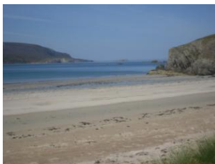
Strand von Durness

Danach geht es an der Westküste entlang weiter nach Norden und zur Nordküste. Hier liegen Durness und Balnakeil. Durness mit 400 Einwohnern gehört zu den schönsten Ecken Schottlands. Hier ist das Land der Regenbogen. Entdecken Sie die Strände von Durness und Balnakeil, und tauchen Sie in die Welt des ( Schokoladen ) - Trüffels ein.