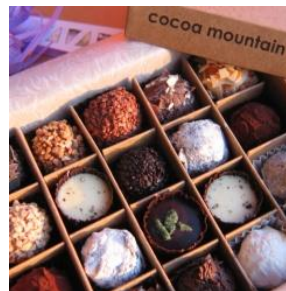
Trüffel von cocoamountain

Auf dem Rückweg bietet sich in Lairg die Gelegenheit eine Tweed-Manufaktur, die Sutherland Sporting Company, zu besuchen. Hier bietet sich dem, der sich für den edlen Tweed Stoff interessiert, alles was das Herz begehrt. Und... - wenn es etwas besonderes sein soll, auch Massanfertigungen sind möglich