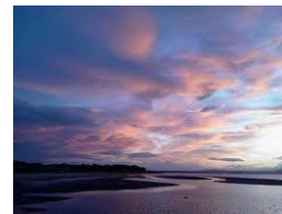
Strand bei Nairn

Hier, vor den Toren Inverness, beziehen Sie für die nächsten 5 Tage Ihr Zimmer in einem Guesthouse. Das kleine, sehr persönlich geführte Guesthouse verfügt über 11 Doppel- und 15 Einzelzimmer. Alle Zimmer sind ausgestattet mit Dusche und WC, sowie der Möglichkeit sich Kaffee und Tee zuzubereiten. Ferner verfügt das Guesthouse über zwei Lounges und eine zusätzliche Sun Lounge, zum Genuss des Kaffees am Nachmittag oder dem Drink von der Bar.